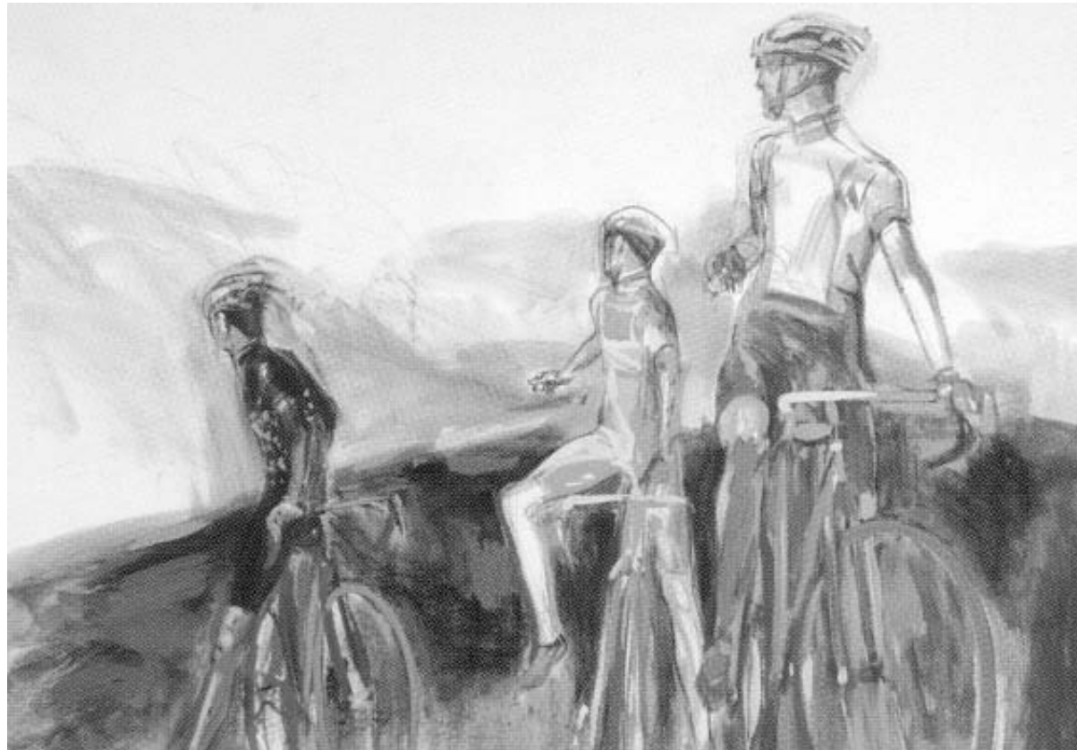
Schilderij Yves BAGE

Schrijven is onderweg zijn, vluchtig proeven, aftasten, kennismaken en herkennen, genietend of vloekend, steeds verwonderd zijn. Schrijven is ook omkijken en wachten. Is verlangen aanscherpen, is leemte even sterk beleven als de vervulling.